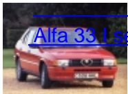
Alfa 33 I serie