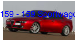
159 - 159 Sportwagon