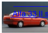
Alfa 33 II serie